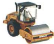
CAT CS-563E Smooth Drum Vibratory Soil Compactor