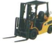
CAT Die-Cast Collectible