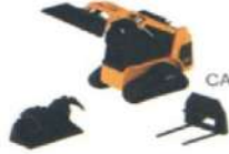
CAT Multi-Terrain Loader With W Tools Die-Cast Collectible