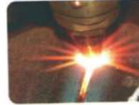
CNC Plasma Cutting Machine