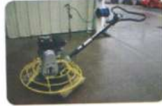
Concrete Power Trowel