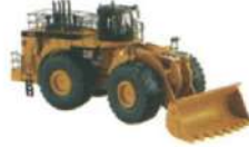
CAT 994F Front Wheel Loader