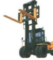
15 ton Forklift