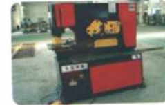
Hydraulic Punch Machine